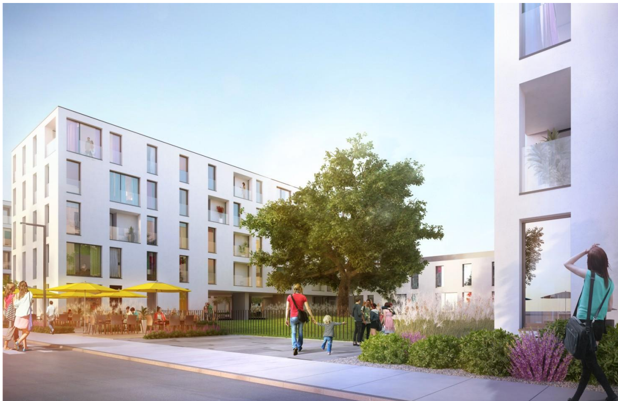
Bobrowiecka 10, Spectra Development. Niniejsza wizualizacja ma charakter informacyjno-marketingowy i nie stanowi oferty handlowej w rozumieniu prawa

Więcej informacji na stronie www.bobrowiecka10.pl