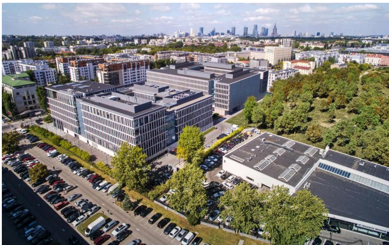
Komplex Bobrowiecka, Spectra Development. Niniejsza wizualizacja ma charakter informacyjno-marketingowy i nie stanowi oferty handlowej w rozumieniu prawa

Sielce na Dolnym Mokotowie są stosunkowo nowym miejscem realizacji projektów deweloperskich w Warszawie. W porównaniu do innych dzielnic Stolicy to wciąż nieodkryty teren inwestycyjny, który ma jednak wiele do zaoferowania. Decyduje o tym atrakcyjne położenie, zaledwie 4 km od ścisłego centrum i rozbudowana infrastruktura, a także ceny mieszkań, które są niższe w porównaniu do najdroższych rejonów Mokotowa. Nowopowstające projekty, takie jak Komplex Bobrowiecka, dodatkowo wzbogacają tkankę miejską Sielc, sprawiając, że staje się to coraz bardziej przyjazne miejsce do życia.